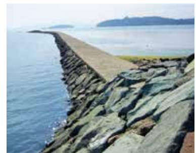
赤子の突き出した石垣とその先の横島

五年(一七五五)宮村の百姓三百人が小舟で乗り付け、赤子新田の石垣を崩す騒動。報復に江上村の百姓は宮村新田の石垣を崩す。両藩の境目役人が出合い、同八年、佐賀鍋島藩の仲裁で、境目文書と絵図を交換し決着を見た。結果、江上側(針尾島・横島を含む)は平戸領、対岸の塔の崎(現在ハウスステンボス橋)より南の宮村は大村領となる。