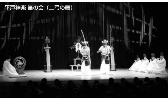
平戸神楽 笛の会 (二弓の舞)

慣れ親しんだ「NHKのど自慢」のテーマミュージックが始まり、フロアの手拍子の鳴りやまぬところに素晴らしい声と笑顔でのご登壇。さすが元NHKエグゼクティブアナウンサーのお話はよどみなく、90分はとて